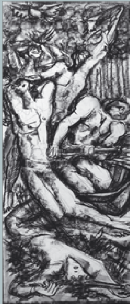
Studio per il Monumento ai caduti di Gussola

COMUNE DI CASALMAGGIORE Assessorato alla Cultura